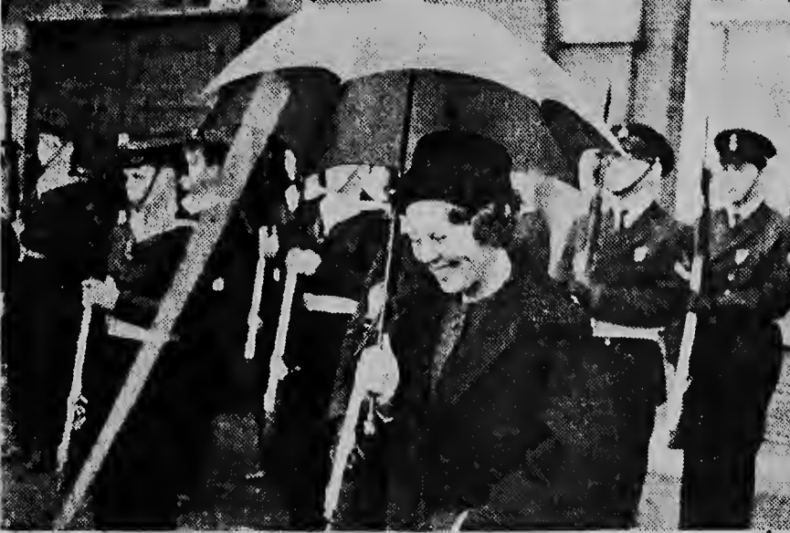
Prinses Beatrix a bishita e departamentonan di Marina Real na Den Helder. Durante e inspeccion di e guardia di honor e Prinses tabatin mester di un paragua.

SAN NICOLAS, 6 december. — Segun nos a worde informa door di e organizadornan di e „short stories contest“, e concursu pa scribimento di storianan cortico esta „Young Men's Christian Association of Aruba“, YMCA va hebi personanan a manda nan historisa adon. Manera cu nos lesadornan va sabi, tur habitantenan di Antillas han di e edad di 30 aña, por liberamente tuma parti. E historianan cu worde scribi mester ta pa lo menos 600 palabra y maximo 1.200 palabra, getvo cu dobel espacio, den cuater conia, y manda no mas laat cu dia 10 venidero. Lo tin premianan pa e mihor historianan den e cuater idiomaan. Hulandes, Ingles, Spanjo y Papiamentu. E mihoran lo worde emprimi, mientras cu e premianan lo worde entrega durante un programa special na Tele-Aruba.